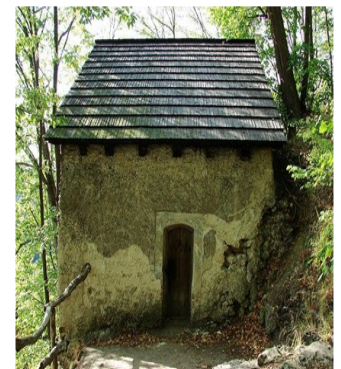
Pustelnia Błogosławionej Salomei