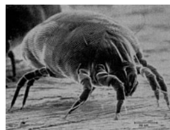
Dermatophagoides pteronyssinus (mieszkaniec naszych łóżek)

Na nasze szczęście królestwem Acari jest gleba. To tam żyje dwie trzecie z nich, a rola, jaką pełnią, ma fundamentalne znaczenie dla trwania życia na ziemi, gdyż biorą udział w procesach glebotwórczych. Te które żyją w ludzkich domach - jak napisał T. Robbins - znają nasze najskrytsze tajemnice, ale jeśli o nich plotkują – to tylko między sobą.