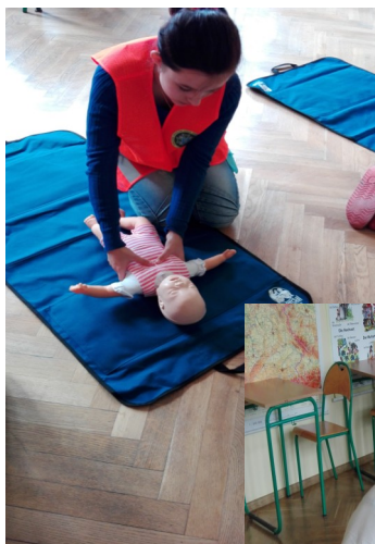
Dziewczyny z klasy II a o profilu ratownictwo medyczne

święta jest błogosławiony Gerard Tonque. Nasi uczniowie z klasy o profilu ratownictwa medycznego również brali udział w tamtym roku w obchodzie święta w Krakowie. Mogli zobaczyć, jak działają poszczególne służby mundurowe GOPR czy pogotowie ratunkowe. Po raz pierwszy mogli zaintubować fantoma. Również zobaczyli karetki z dawnych lat i ich zawartość. Były pokazane nowoczesne sprzęty w ratownictwie medycznym jak np. urządzenie kompresji klatki piersiowej lub pokazanie nowoczesnej karetki do przewozu osób z otyłością.